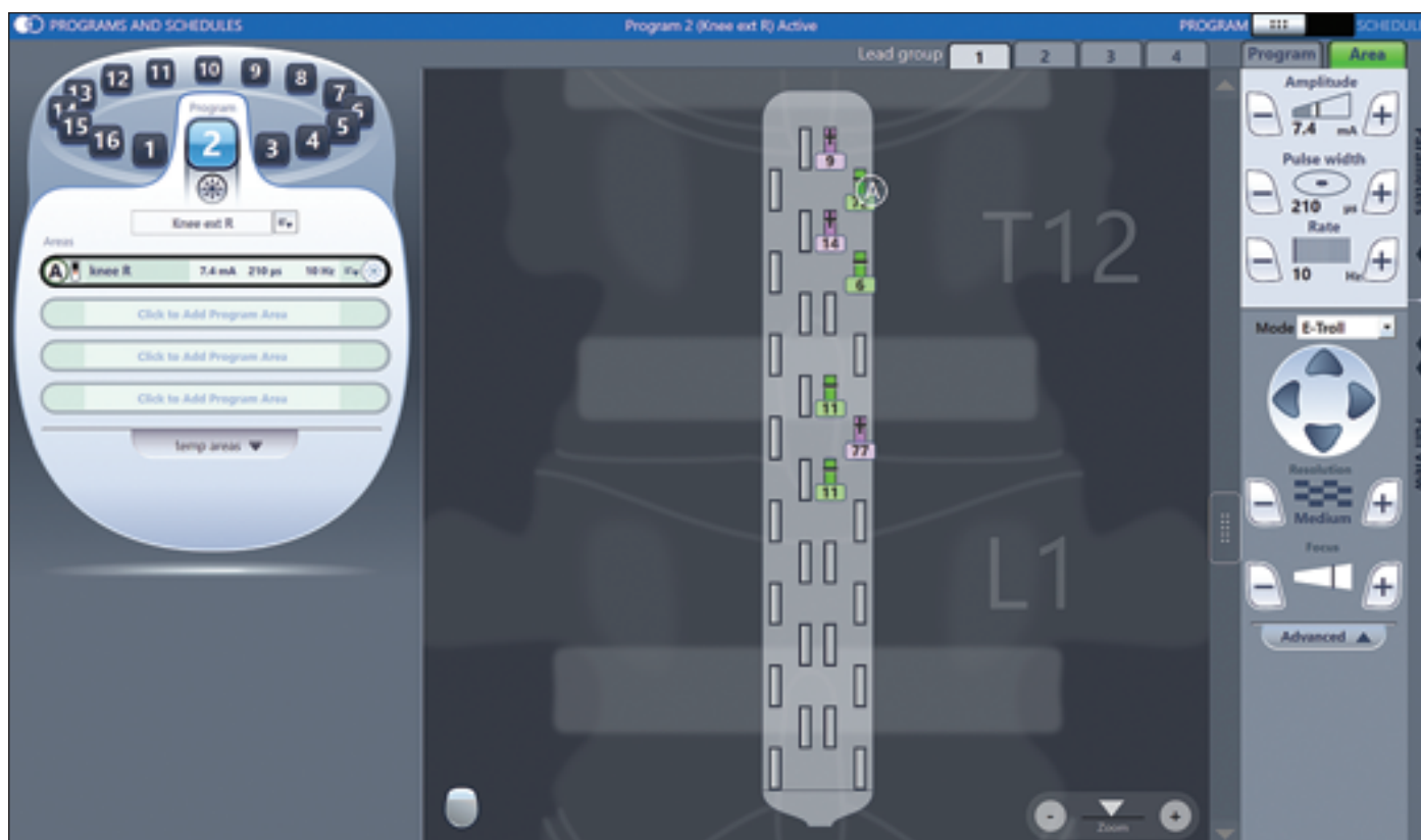
Obr. 2. Stimulační program pro extenzi kolene (NCT05690074).

Nastavený program spouští stimulaci m. quadriceps femoris s následnou extenzí pravého kolenního kloubu. Na schematicky znázorněné elektrodě je patrné umístění ohniska, kam je stimulace zacílena. Nastavitelné stimulační parametry jsou šířka pulzu, frekvence a amplituda.