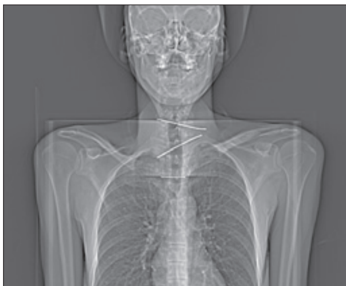
Obr. 1. RTG. Topogram pacienta.