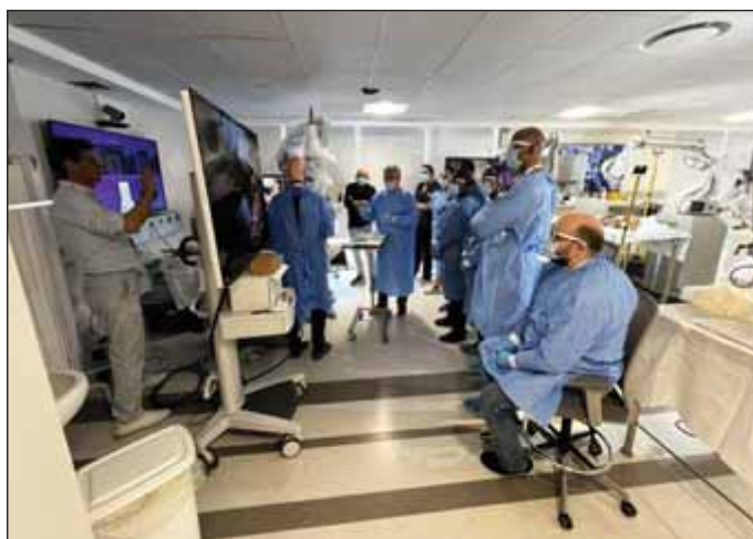
Obr. 1. Demonstrace anatomické preparace a simulace karotické endarterektomie v kadáverovní laboratoři v Neuroscience Institute Cape Town.