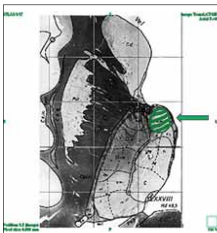
Obr. 1. Poloha nucleus anterior thalami (ohraničeno zeleně) ve vztahu ke strukturám komorovému systému (převzato z elektronického atlasu Schaltenbrand Bailey).

Pro studii byly využity preparáty Anatomického ústavu LF MU v Brně s provedeným nástřikem nitrolebních arterií a žil primárně připravené pro edukační kurzy zaměřené na neurochirurgické a otorinolaryngologické operační přístupy.