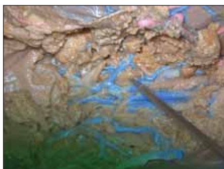
Obr. 7. Ohraničení cévního koridoru pro implantaci elektrody do nucleus anterior thalamu. Patrný žilní přítok do v. thalamostriata, právě z oblasti nucleus anterior thalami (označen sondou). Částečně zachované struktury plexus chorioideus Fig. 7. The borders of the vascular corridor for anterior thalamic electrode implantation. Venous tributary to the thalamostriatal vein from the anterior thalamic nucleus (marked with a probe). Partially preserved structures of the choroid plexus.

tuaci s šířkou koridoru 2,5 mm a 3 mm (medián šíře cévního koridoru ve vzdálenosti 2 mm od jeho začátku pro pravou a levou stranu), 4 mm (medián šíře cévního koridoru ve vzdálenosti 4 mm od jeho začátku), a konečně 4–4,5 mm (medián 6 mm od začátku koridoru). Po odečtení 1,3 mm na průměr elektrody zůstává ve vzdálenosti 2 mm rezerva 0,85 mm pro levou stranu a 0,6 mm pro stranu pravou a ve vzdálenosti 4 mm rezerva 1,35 mm mezi okrajem elektrody a okrajem v. thalamostriata a v. chorioidea superior (pokud by elektroda byla zavedena přesně středem koridoru). Ve vzdálenosti 6 mm je rezerva 1,35–1,6 mm.