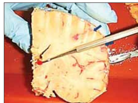
Obr. 3. Laterální trajektorie elektrody do nucleus anterior thalami – naznačeno pátradlem. Modré šipky vymezují laterální koridor pro zavedení elektrody do nucleus anterior thalami (vyznačeno červeným polem).

Fig. 2. Coronal section of the brain at the level of the anterior thalamic nucleus – the probe shows the transventricular trajectory to the nucleus anterior thalami (blue arrow). Subependymal vein located in the roof of the lateral ventricle in the proximity of the intended trajectory (green arrow).