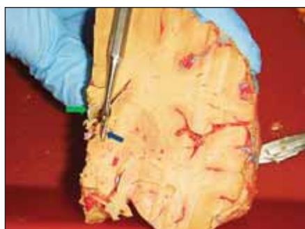
Obr. 2. Koronární řez mozkiem v úrovni nucleus anterior thalami – pátradlo ukazuje průběh transventrikulární trajektorie do nucleus anterior thalami (modrá šipka). V blízkosti zamýšlené trajektorie patrna subependymální žíla ve stropu postranní komory (zelená šipka).

Fig. 1. The position of the anterior thalamic nucleus (green borders) and its relationship to the structures of the ventricular system (modified from the Schaltenbrand Bailey e-atlas).