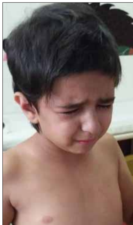
Obr. 1. Hypertelorismus, široký kořen nosu.

Fig. 1. Hypertelorism, wide root of the nose.