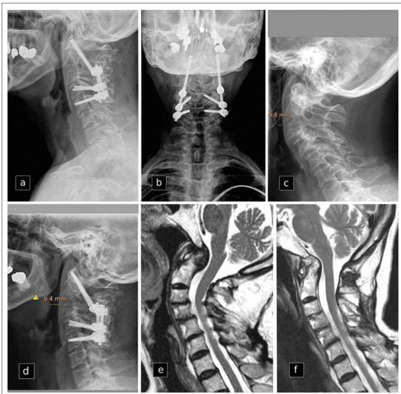
Obr. 2. Pooperační rentgenogramy krční páteře (a, b). Porovnání předoperačního (c) a pooperačního (d) laterálního rentgenogramu se zdůrazněním rozšířeného negativního kontrastu vzduchu v horních cestách dýchacích a porovnání předoperačního (e) a pooperačního (f) zobrazení MR zachycuje změnu konfigurace krční a vymizení retrodentálního panu 2 roky po stabilizaci.

Fig. 2 Postoperative cervical spine radiographs (a, b). Comparison of preoperative (c) and postoperative (d) lateral radiograph with emphasis on extended negative air contrast in the upper respiratory tract and comparison of preoperative (e) and postoperative (f) MRI shows a change in cervical spine alignment and the disappearance of the retrodental panus 2 years after stabilization.