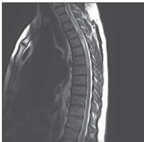
Obr. 1. MR hrudní a krční páteře, T2-vážený obraz, sagitální projekce. Hyperintenzní intramedulární ložisko v úrovni třetího a čtvrtého hrudního obratle s výrazným edémem míchy.

Fig. 1. MRI of cervical and thoracic spine, T2-weighted image sagittal projection. Hyperintense intramedullary lesion at the level of the third and the fourth thoracic vertebra with significant spinal cord edema.