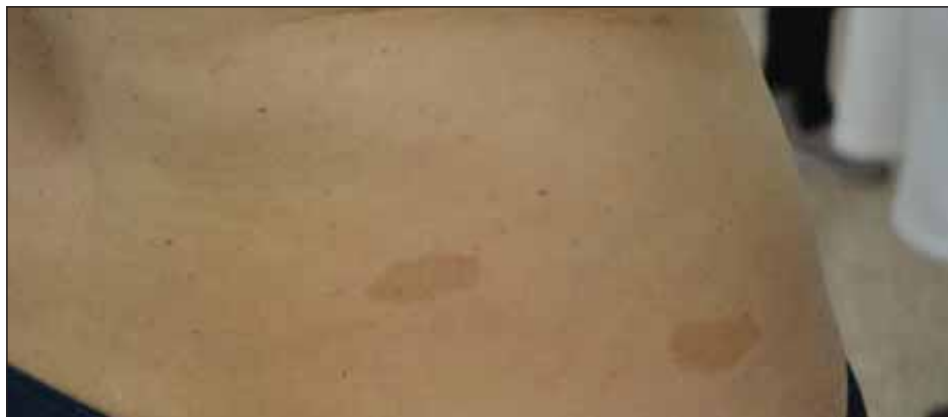
Obr. 1a. Skvrny café-au-lait na kůži trupu u diagnózy Legius syndrom.

Nyní 16leté sestry (jednovaječná dvojčata), byly sledovány pediatrem pro pozitivní perinatální anamnézu (gemini, akutní porod císařským řezem pro preeklampsii matky v 36. týdnu gravidity) a nízkou porodní hmotnost (dvojče A s porodní hmotností 2 240 g, délkou 44 cm, dvojče B s porodní hmotností 2 140 g, délkou 44 cm). Poporodní adaptace byla u obou dobrá. Obě měly přiměřený psychomotorický vývoj se samostatnou chůzí od 1 roku věku a přiměřeným vývojem řeči. Pro kožní nález CALM (obr. 1a) a podezření na NF1 byly dívky ve věku 2,5 roku odeslány k vyšetření do dětské neurologické ambulance FN Motol, kde jsou sledovány až dosud. Také matka a maternální babička dívek mají kožní nález CALM. Neurologický nález byl u obou dívek trvale bez ložiskových změn, bez dysmorfických rysů obličeje (kromě hlouběji posazených očí), s malým vzrůstem, s lehkým pectus excavatum a genua vara. U sester nebyly nalezeny neurofibromy, Lischovy noduly ani kostní