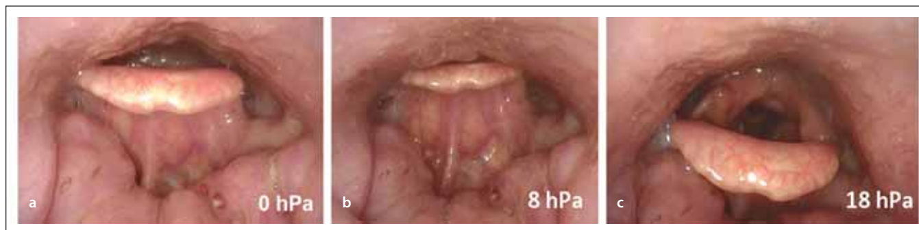
Obr. 1. Endoskopie v uměle navozeném spánku s CPAP, pohled do hypofaryngu a na vchod hrtanu flexibilním endoskopem – (a) předozadní obstrukce v oblasti epiglottis při tlaku 0 hPa; (b) kolaps epiglottis při použití tlaku 8 hPa, selhání CPAP, zhoršení obstrukce; (c) oddálení epiglottis od zadní stěny hltanu až při tlaku 18 hPa.