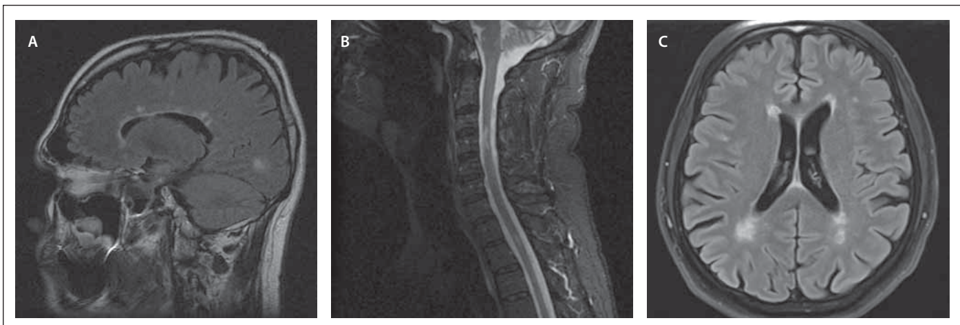
Obr. 1. Vyšetření MR.

(A) Mozek, T2 FLAIR sekvence, sagitální obraz – vícečetná hyperintenzní ložiska v periventrikulární bílé hmotě mozku uložena při postranní komoře – obraz „Dawsonových prstů“ (typický obraz distribuce demyelinizačních ložisek při RS).