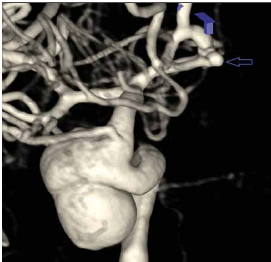
Obr. 1. DSA 3D. Gigantické intrakavernózní aneuryzma pravé karotidy. Modrá šipka ukazuje incidentální aneuryzma přední komunikanty.

Fig. 1. 3D DSA. Giant intracavernous aneurysm in the right internal carotid artery. Blue arrow shows incidental aneurysm of the anterior communicating artery.