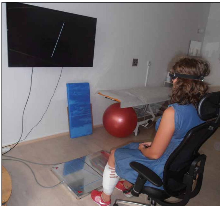
Obr. 1. Vyšetření subjektivní zrakové vertikály.

Při vyšetření subjektivní zrakové vertikály před operací měli čtyři pacienti indikovaní ke kochleární implantaci odchylku vertikály nad rozmezím fyziologické normy (větší než \pm 2^\circ