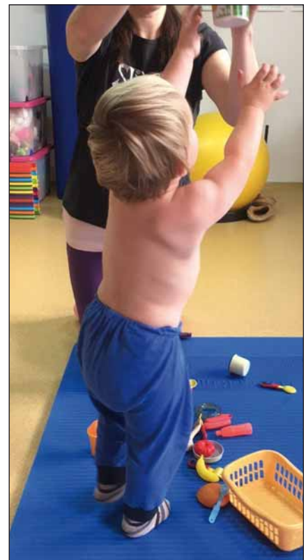
Obr. 2. Věk 2,5 roku, úchop předmětu ve vzpažení, patrný větší souhryb lopatky do abdukce a zevní rotace, než je odpovídající rozsahu pohybu do flexe v rameni pravé horní končetiny, stále lehce vážne supinace předloktí.

1. Maccko J. Perinatální paréza brachiálního plexu. Čes Gynek 2010; 75(4): 279–283.