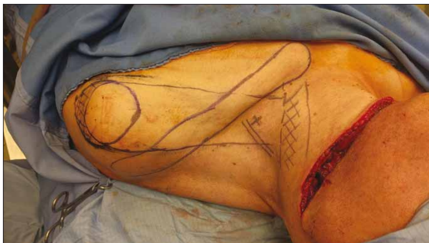
Obr. 2. Peroperační náčrt laloku (pacient č. 1).

Fig. 1. Size and location of the tumor before surgery (patient No. 1).