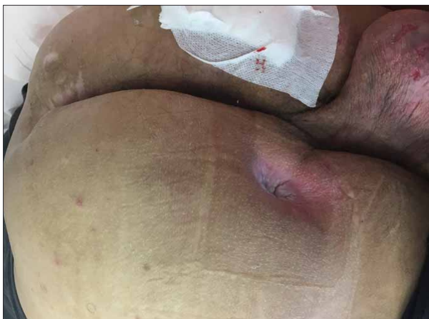
Obr. 4. Píštěl ischiadického dekubitu vlevo, sakrální dekubitus.

Ischiadické dekubity jsou nejčastější u pacientů připoutaných na invalidní vozík a velmi hojně se vyskytují ve formě píštělí. V takovém případě může být na kůži patrný defekt jen několik mm, jako je tomu u našeho pacienta (obr. 4, 5), ale v podkoží se zpravidla nachází několikacentimetrová kapsa (příčměž píštěle mohou komunikovat s jinými orgány). Z toho důvodu je nezbytné důsledné dovyšetření terénu defektu i okolní tkáně. Pokud je lytický tuber