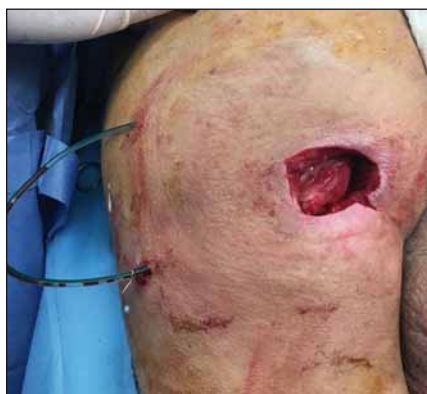
Obr. 6. Transpozice distální porce m. gluteus maximus nad tuber ischiadicum.

Fig. 5. Condition after necrectomy of sacral and both sciatic decubitus (pressure ulcers).