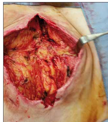
Obr. 3. Obrázek dekubitu po nekrektomii.

Fig. 2. Extirpation of pseudocyst of decubitus (pressure ulcer).