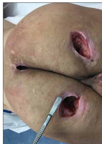
Obr. 5. Stav po nekrektomii sakrálního a obou ischiadických dekubitů.

Fig. 4. Fistula of the left ischiadic (sciatic) pressure ulcer, sacral decubitus (pressure ulcer).