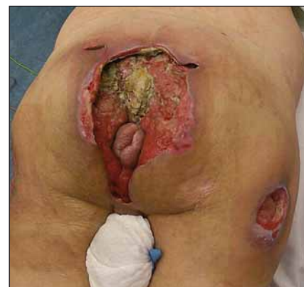
Obr. 7. Rozsáhlý sakrogluteální dekubitus. Fig. 7. Extensive sacrogluteal decubitus (pressure ulcer).

*Nejčastěji prováděn na pracovišti autorů.