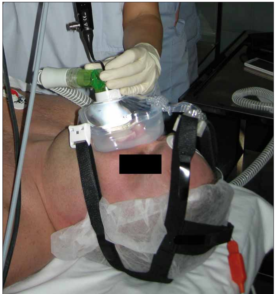
Obr. 1. Spánková endoskopie s přetlakovou ventilací.

K DISE současně se CPAP byli indikováni pacienti s těžkou OSA, kteří netolerovali léčbu CPAP. Současně bylo třeba, aby byl dostupný neurolog, který toto vyšetření na operačním sále prováděl zároveň s ORL lékařem a anesteziologem. Po provedení DISE byla, v případě indikace současného vyšetření DISE se CPAP, pacientovi na obličej přiložena maska CPAP, která byla předem vybrána a vyzkoušena již na oddělení, aby dobře těsnila. Mezi masku a hadici přístroje byl vložen speciální ventil, jenž umožňoval vsunutí endoskopu o průměru 3,5 mm do masky, aniž se porušila její těsnost (obr. 1). Vyšetření bylo zahájeno tlakem 6 hPa, v každé ze čtyř etází (měkké patro, laterální stěny hltanu, kořen jazyka a epiglottis) byl endoskop postupně zastaven a byly sledovány obstrukce, jejich stupeň a typ. HCD byly takto vyšetřeny při tlacích 6, 8, 10, 12, 14 a 18 hPa. Jednotlivé záznamy byly nahrány, hodnocení probíhalo ihned v průběhu vyšetření. Byl hodnocen vizuální efekt CPAP na snížení obstrukce HCD současně s hodnotami saturací krve kyslíkem (SpO 2 ) měřeným na prstu horní končetiny. Tím byl stanoven tlak optimální pro udržení hodnot SpO 2 mezi 96 a 100 %.