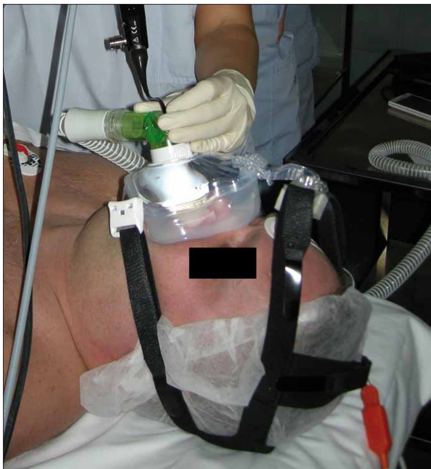
Obr. 1. Spánková endoskopie s přetlakovou ventilací.

K DISE současně se CPAP byli indikováni pacienti s těžkou OSA, kteří netolerovali léčbu CPAP. Současně bylo třeba, aby byl dostupný neurolog, který toto vyšetření na operačním sále prováděl zároveň s ORL lékařem a anesteziologem. Po provedení DISE byla, v případě indikace současného vyšetření DISE se CPAP, pacientovi na obličej přiložena maska CPAP, která byla předem vybrána a vyzkoušena již na oddělení, aby dobře těsnila. Mezi masku a hadici přístroje byl vložen speciální ventil, jenž umožňoval vsunutí endoskopu o průměru 3,5 mm do masky, aniž se porušila její těsnost (obr. 1). Vyšetření bylo zahájeno tlakem 6 hPa, v každé ze čtyř etází (měkké patro, laterální stěny hltanu, kořen jazyka a epiglottis) byl endoskop postupně zastaven a byly sledovány obstrukce, jejich stupeň a typ. HCD byly takto vyšetřeny při tlacích 6, 8, 10, 12, 14 a 18 hPa. Jednotlivé záznamy byly nahrány, hodnocení probíhalo ihned v průběhu vyšetření. Byl hodnocen vizuální efekt CPAP na snížení obstrukce HCD současně s hodnotami saturací krve kyslíkem (SpO 2 ) měřeným na prstu horní končetiny. Tím byl stanoven tlak optimální pro udržení hodnot SpO 2 mezi 96 a 100 %.