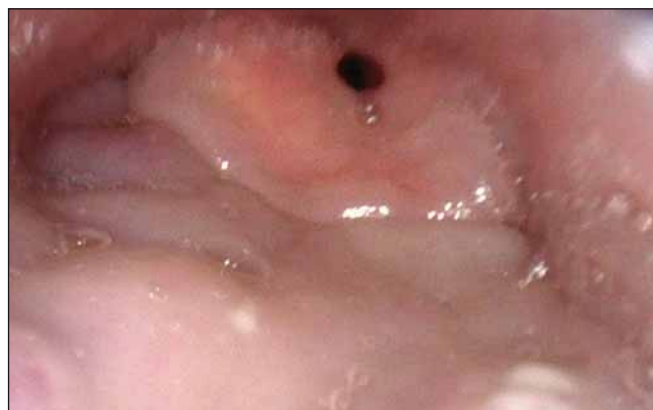
Obr. 3. DISE – obstrukce v retrolinguální oblasti způsobená hypertrofickým kořenem jazyka.

Fig. 2. DISE – concentric closure of velopharyngeal strait.