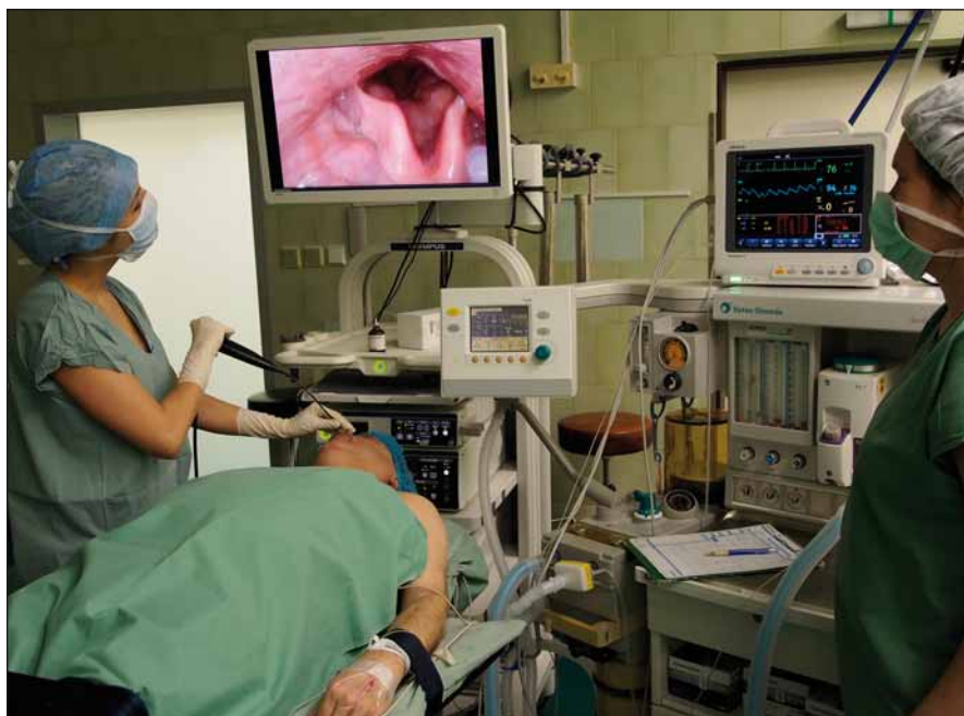
Obr. 1. Postup při DISE vyšetření u pacienta s OSAS na operačním sále.

Fig. 1. DISE procedure for examination of patients with OSAS in an operating theatre.