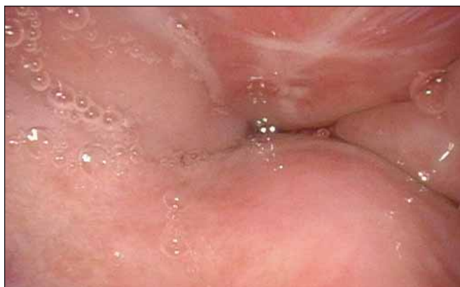
Obr. 2. DISE – koncentrický uzávěr v oblasti velofaryngeální úžiny.

Fig. 2. DISE – concentric closure of velopharyngeal strait.