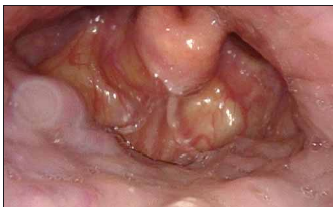
Obr. 4. DISE – obstrukce způsobená laterálním kolapsem ztlustělé epiglottis.

Fig. 3. DISE – obstruction in the retrolingual area due to hypertrophic root of the tongue.