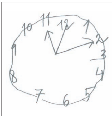
Obr. 2. Ciferník s časem 11:10 obsahuje tři ručičky.

Více ručiček v ciferníku dokládá význam slov „právě 2 ručičky“ v otázce 2 a „obě ručičky“ v otázce 5 skórovacího systému BaJa.