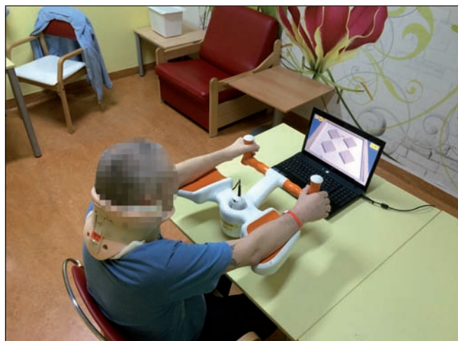
Obr. 15. Nácvik koordinace horních končetin a stability trupu u tetraparetického pacienta s využitím přístroje Pablo Multiboard formou interaktivní zpětné vazby.

V rehabilitaci spinálních pacientů lze přístroj Pablo použít u kompletních i nekompletních krčních lézí. Zatímco u nekompletních lézí můžeme využít celé spektrum nabízených modulů, u pacientů s motoricky kompletní krční lézí jsme ve výběru modulů omezení aktivitou pouze určitých svalových skupin (obr. 15). Výhodou je terapie formou interaktivních her, které poskytují pacientům zpětnou vazbu o prováděných pohybových aktivitách a zvyšují jejich motivaci. K té přispívá i možnost sledování výstupů z pravidelného měření svalové síly. Další nespornou výhodou přístroje je jeho nízká hmotnost, dobrá přenosnost a rychlé nastavení.