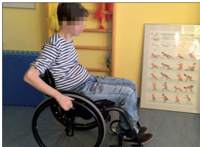
Obr. 2. Postura tetraplegického pacienta vsedě na vozíku.

Pacienti po poranění míchy mají v různém rozsahu porušenu funkci trupových svalů. Právě jejich koordinovaná aktivita je nezbytná pro zajištění stabilní postury [13]. Posturou rozumíme aktivní držení segmentů