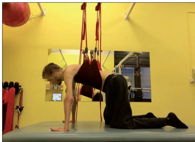
Obr. 11. Využití závěsu Redcord pro nácvik opory o horní končetiny a antigravitačního držení krční páteře v posturálně náročnější situaci.

Fig. 10. Active exercise of the upper limbs with support according to proprioceptive neuromuscular facilitation.