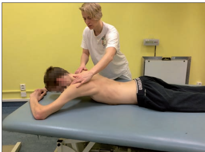
Obr. 8. Návčik stereotypu opory o horní končetinu s korekcí držení ramenních pletenců.

Cvičební poloha je volena dle vývojové kineziologie.