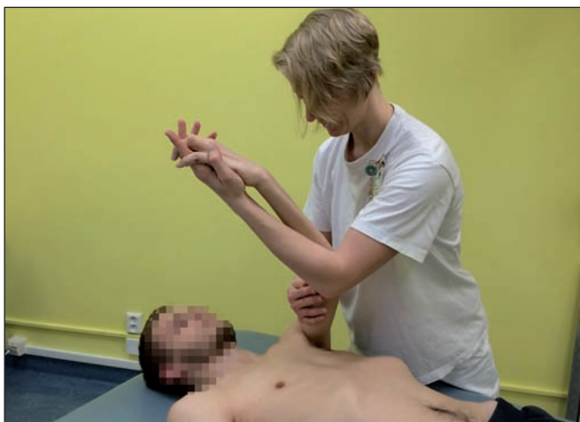
Obr. 10. Aktivní cvičení horní končetiny s dopomocí dle proprioceptivní neuromuskulární facilitace.

Fig. 10. Active exercise of the upper limbs with support according to proprioceptive neuromuscular facilitation.