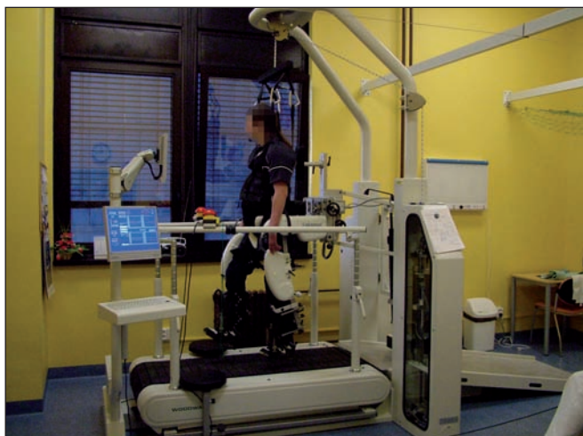
Obr. 12. Návčik chůzového stereotypu na přístroji Lokomat. Fig. 12. Practicing gait stereotype on the Lokomat.

pánve do lateroflexe a rotace) a omezená možnost souhybu horních končetin (obr. 12).