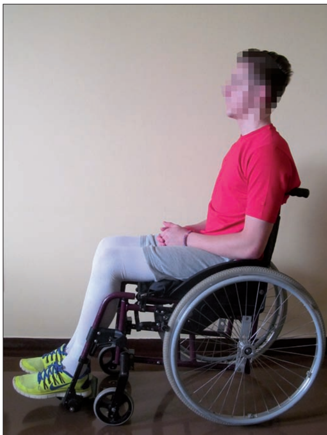
Obr. 3. Postura paraplegického pacienta vsedě na vozíku.

Pánev je nastavená ve středním postavení, zatížení je více na sedacích hrbolcích. Trup je napříměný, hlava držena v ose páteře.