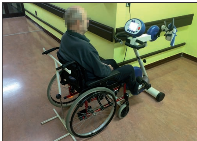
Obr. 13. Využití přístroje MOTomed pro pasivní cyklický pohyb dolních končetin.

Funkční elektrická stimulace (FES) vyvolává pomocí elektrických impulzů svalové kontrakce zajišťující specifický pohyb nebo funkci cílového orgánu a nahrazuje tak jejich poru-