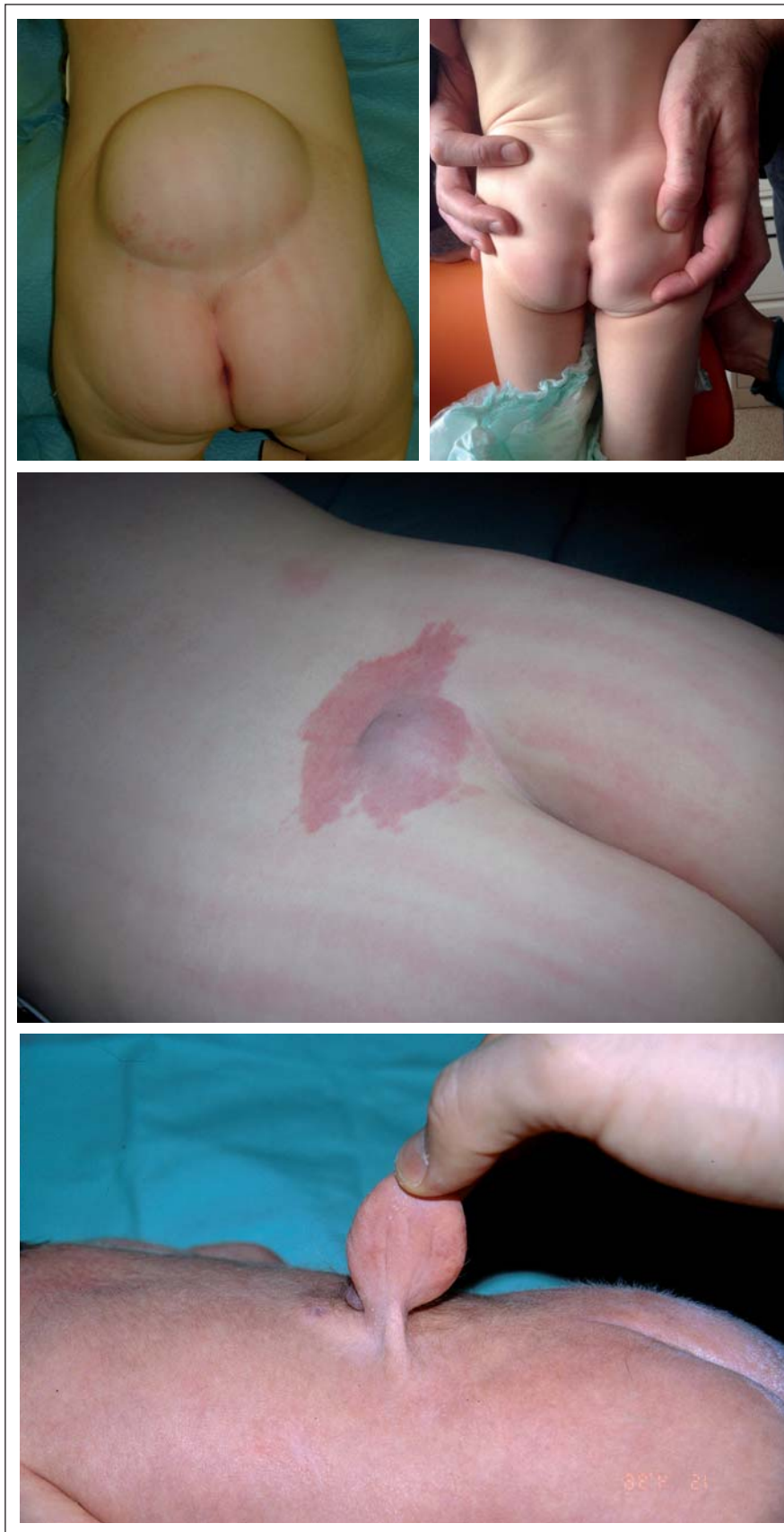
Obr. 1–4. Kožné prejavy spinálneho lipómu.

K upresneniu sprievodných zmien na skelete (defekt oblúka stavcov, kostné zmeny pri diastematomyelii) je výhodné vyšetriť pacienta na CT. U novorodencov a menších detí je k vylúčeniu zmien na nervovom tkanive možné použiť ultrasonografické vyšetrenie, ktoré však musí robiť skúsený rádiodiagnostik.