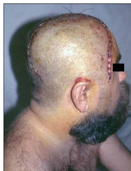
Obr. 3. První pooperační den je nemocný opět při vědomí. Pohled na dekompresi provedenou z „omega“ řezu.