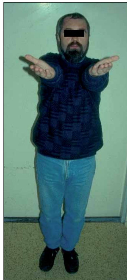
Obr. 5. Nemocný při ambulantní kontrole je při jasném vědomí, bez poruchy hybnosti.

Agrawal et al prezentovali případ nemocného s vícečetnými parazitárními abscesy (toxoplazmóza), u kterého byla provedena dekompresivní hemikraniektomie pro akutní rozvoj bezvědomí způsobeného tentoriální hernií [11]. Zakaria et al publikovali kazuistiku komplikovaného průběhu mozkového abscesu způsobeného nokardií. Součástí léčby byla bifrontální dekompresivní kraniektomie [12]. Mraček et al řešili expanzivní projevy