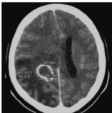
Obr. 1. CT po podání kontrastní látky ukazuje kulovité ložisko (20 × 28 × 15 mm) s enhancujícím prstenčítým lemem v hloubce pravé mozkové hemisféry. Kolaterální edém způsobuje středočárový přetlak 13 mm.

s decerebrační reakcí končetin a pravostrannou mydriázou. CT mozku ukázalo progresi kolaterálního edému a středočárového přetlaku, abscesová dutina byla parciálně kolabovaná (10 × 17 × 10 mm) (obr. 2). Akutně jsme provedli pravostrannou dekompresivní hemikraniektomii. Po operaci se během několika dnů klinický obraz nemocného téměř upravil, přetrvávala inkompletní levostranná hemianopsie (obr. 3). Z punktátu byl vykulitován Peptostreptococcus a Fusobacterium necrophorum . Přestože na penicilin byly citlivé oba druhy bakterií, terapie byla posílena cefazolinem (4 × 1 g/24 hod). V uvedené dvojkombinaci antibiotik bylo pokračováno po celou dobu hospitalizace. Kortikoidy byly po dekompresi vysazeny, ve frakcionovaném podávání 20% manitolu bylo pokračováno až do zmírnění expanzivních projevů na grafickém vyšetření. Kontrolní CT 25. pooperační den ukázalo regresi edému a pouze drobné reziduum abscesového ložiska (obr. 4). Po 29 dnech od dekomprese byla provedena replantace kostní ploténky. Nemocný byl přeložen na neurologii 45. pooperační den při jasném vědomí, bez poruchy hybnosti s parciální levostrannou hemianopsií. Antibiotika byla vysazena po devíti týdnech hospitalizace, kdy dle MR kontroly byl absces zhojen a zánětlivé parametry v normě. Při ambulantní kontrole šest týdnů po propuštění byl nemocný subjektivně bez potíží, objektivně s rezii