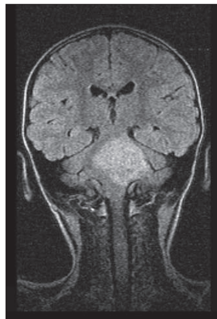
Obr. 1. Pacient 3. Gliom mozkového kmene.

Čtyřletá dívka, jejíž rodiče uváděli přisátí a odstranění klíštěte v oblasti hlavy, byla přijata na KDIN v Brně. Po dvouměsíční inkubační době se objevila nápadná únava, spavost, bolesti břicha, horečka až 39 °C s následným rozvojem periferní obrny lícního nervu vlevo s lagofthalmem do 4 mm. Léze lícního nervu byla hodnocena jako infrachordální a ostatní ložiskový neurologický nález jako normální. Oční pozadí nevykazovalo známky měštnání. Pro po-