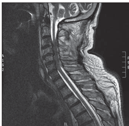
Obr. 3. Kazuistika 2 – MR. Sagitální T2 vážený obraz, lehká krční lordóza, spinální stenóza C3–6, dorzální epidurální abscesy C3–6 s útlakem míchy.