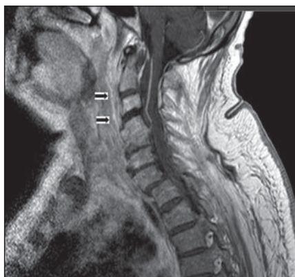
Obr. 1. Kazuistika 1 – MR.

Sagitální řez, T1 vážený obraz. C1–5 ventrální prevertebrální prosáknutí. Spondylodiscitida C3–4. Etáže C2–3 a C3–4 označeny šipkami. Přední epidurální absces C1–4, spontánní srůst – fúze C4–5.