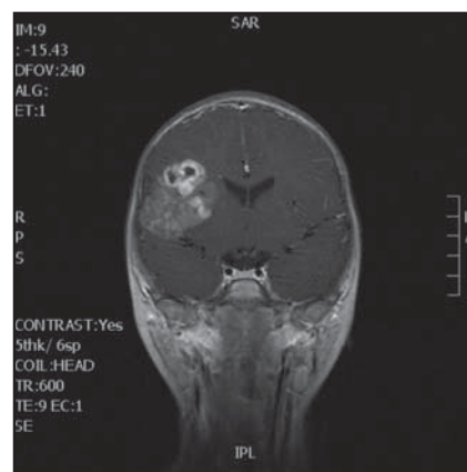
Obr. 4. MR v koronární rovině s intraaxiálním tumorem.

V Cesk Slov Neurol N 2013; 76/109(4) byl v článku „Krahulík D et al. Dysembryoplastický neuroepiteliální tumor a jeho atypická varianta u dětí – kazuistiky“ na straně 493 chybně vytištěn obrázek 4. Autorům se omlouváme a přikládáme opravenou verzi obrázku 4.