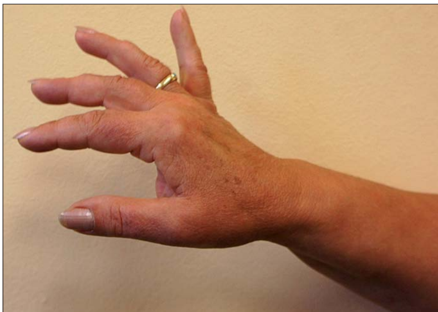
Obr. 3. Pacientka 1.

Výsledky operací u čtyř operovaných pacientů ukazuje tab. 1. Ve všech případech došlo k výraznému zlepšení motorické funkce všech tří sledovaných svalů. Velmi se tak zlepšila hybnost ruky s navrácením její úchopové funkce. U žádného pacienta však nedošlo ke zlepšení svalové síly na úroveň druhostranné končetiny. EMG vyšetření potvrdilo zlepšení nálezu, u všech však trvá parciální denervační syndrom motorické složky NR (obr. 3). K největšímu zlepšení hybnosti i EMG nálezu došlo během prvních šesti měsíců, následně již nebyly větší rozdíly zaznamenány.