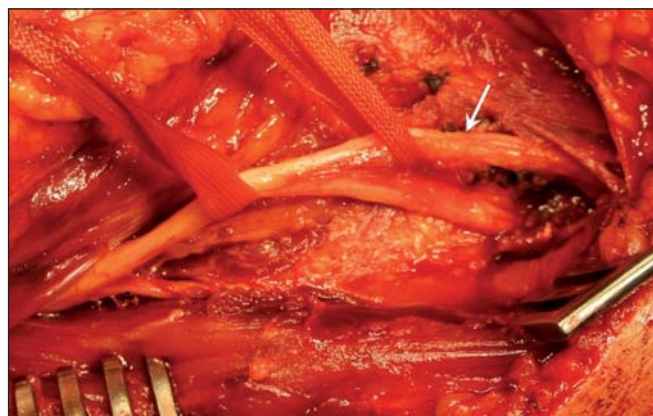
Obr. 2. Peroperační snímek po dekompresí NR v oblasti Frohseho arkády.

1 – rami musculares, 2 – kmen n. radialis, 3 – r. superficialis, 4 – r. profundus, 5 – m. brachioradialis. Šipka ukazuje Frohseho arkádu.