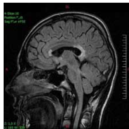
Obr. 2. Ten istý pacient s postihnutím genu a splenium corpus callosum v T2V sagitálnej projekcii.

endogénnej syntézy VLCFA zmesou glycerol trioleatu a glycerol trierukátu v pomere 4 : 1 nazvanou Lorenzov olej. Podávanie zmesi normalizuje hladinu VLCFA, avšak zásadne nemení klinický obraz rozvinutého ochorenia, keďže nereparuje už vzniknuté poškodenie. Podľa štúdie Mosera et al z roku 2005 je navrhutá liečba Lorenzovým olejom u asymptomatických pacientov na oddialenie nástupu neurologického postihnutia a zmiernenie priebehu [14].