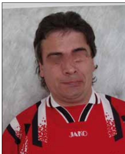
Obr. 6. Hemifaciální spasmus vlevo u 40letého muže, sportovce. Pro noční spazmy se sevřením levé nosní dírky nemůže spát na levém boku.

kací je možná aplikace z ruky do určitého svalu. Doporučuje se aplikovat do ploténkové zóny svalu a u větších anebo delších svalů do více míst. U hlouběji uložených svalů či u dystonických svalů je vhodná aplikace za EMG kontroly signálu. Použije se dutá EMG a botulotoxin se aplikuje do místa svalu s maximální dystonickou aktivitou nebo u spasticity do místa s výraznou aktivitou provokovanou protažením