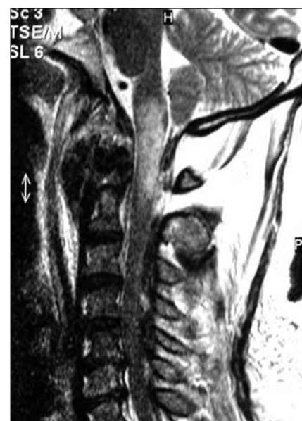
Obr. 4. Kontuze a edém prodloužené míchy u přežívající pacientky.

alární ligamenta a tektoriální membrána. Samotné kostní spojení je pak zajištěno kloubem mezi okcipitálními kondylky a laterálními masami atlasu [18,19]. Ligamentum apicale, alare a cruciatum dále přímo spojují okciput a axis. Axis tudíž tvoří integrální součást KVJ, není tedy překvapující, že nejčastější přidružené poranění KVJ byla atlantoaxiální dislokace [6], i v našem souboru se našel jeden takový pacient. Znalost rozsahu dalšího poranění