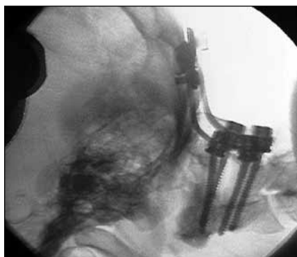
Obr. 2. Pooperační snímek pacientky, která podstoupila zadní stabilizaci C2–C0 pro AOD.

byli všichni pacienti intubováni a řízeně ventilováni, ani přes minimální sedaci u žádného z nich nebyla shledána adekvátní odpověď na výzvu, rovněž nebyl pozorován žádný pohyb na končetinách, a to ani na silný algický podnět. Všichni pacienti byli tedy hodnoceni jako Glasgow Coma Scale (GCS) 3. Krátce po provedení základních diagnostických testů pět z nich zemřelo (30 minut–4 hodiny). Poslední pacientku se podařilo stabilizovat a následně podstoupila výše popsanou zadní stabilizaci C0–C2 (obr. 2). Po operaci u ní došlo ke zlepšení stavu do té míry, že byla schopna komunikovat pomocí otevírání a zavírání očí, nicméně nadále přetrvával obraz chabé kvadruplegie. I přes provedenou tracheostomii se nezdařilo odpojení od umělé plicní ventilace a navzdory veškeré intenzivní péči podlehl po 59 dnech ventilační pneumonii a sepsi.