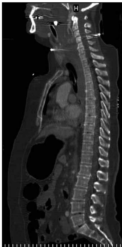
Obr. 5. Sagitální rekonstrukce spirálního CT celé páteře ukazující AOD spolu s přerušenu arteria basilaris. Vyšetření provedené v rámci polytraumatického protokolu.

KVJ je nezbytná při plánování stabilizačního výkonu.