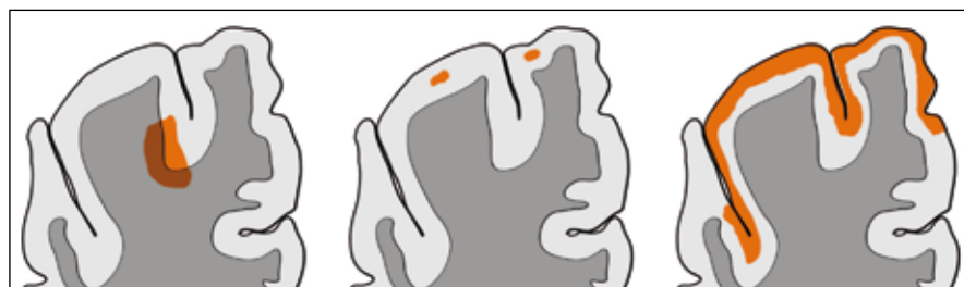
Obr. 3. Typy kortikálních lézí. Typ I navazuje na juxtakortikální léze v BH, typ II výhradně kortikální a III. typ subpiální. Podle [15].

u progresivní RS není spojena s významnější poruchou HEB [16].