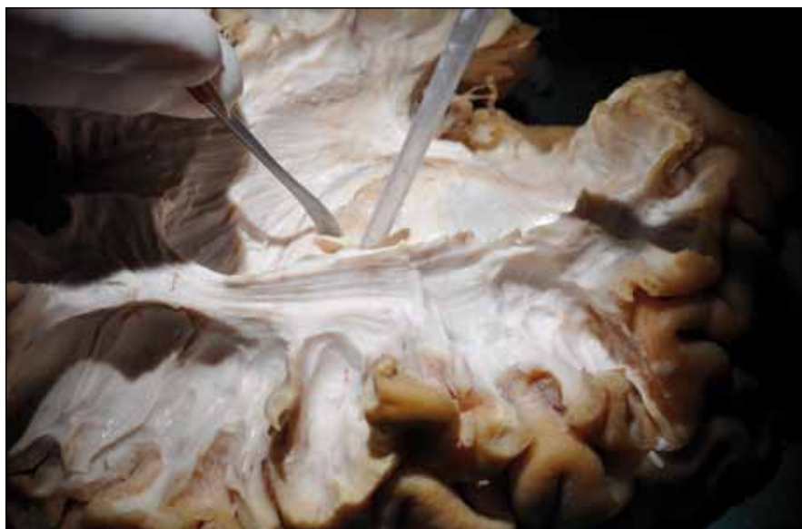
Obr. 2. Disekce bílé hmoty.