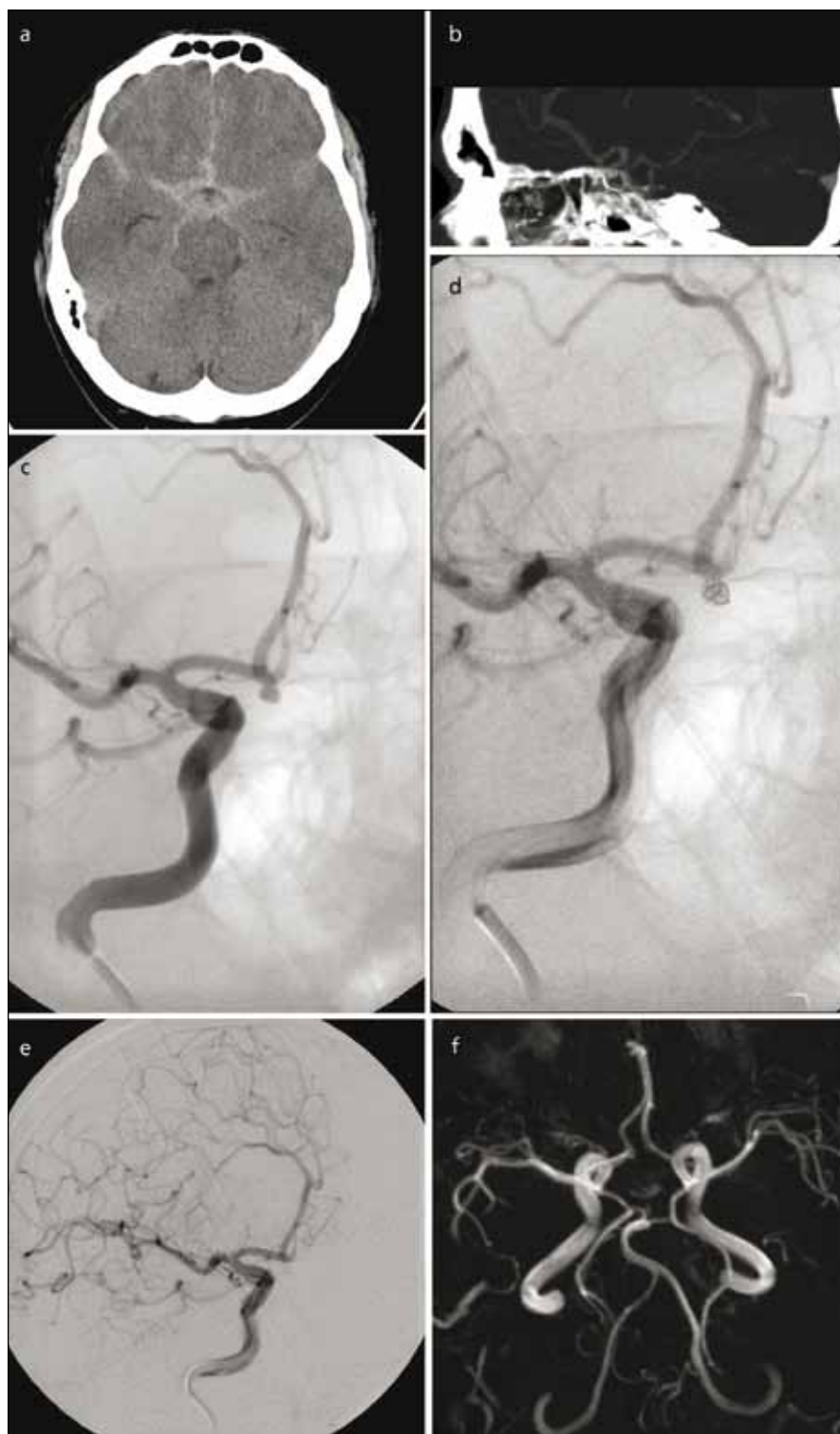
Obr. 1. 51letý muž se subarachnoidálním krvácením před 3 dny. Vzbuditelný, odpovídá jednoslovně.

Obr. 1a) CT prokazuje symetrické rozložení krve v bazálních cisternách. Obr. 1b) CT angiografie zobrazila 3 mm velké aneurysma a. communicans anterior směřující kauzálně. Obr. 1c) Provedená angiografie detailně zobrazila aneurysma. Nemocný byl uveden do celkové anestezie. Obr. 1d) Mikrokátérem zavedena první spirála.