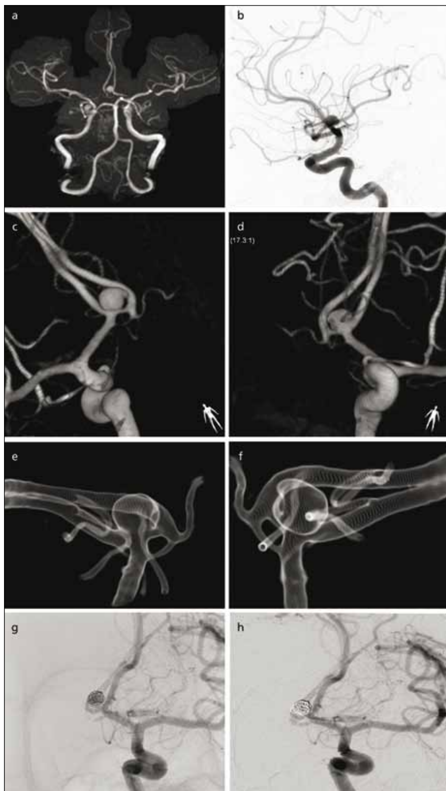
Obr. 3a) 46letá žena, hypertonička s náhodně nalezeným aneuryzmatem a. communicans anterior velikosti 7 mm s naznačeným sekundárním vakem na MR provedené pro záchvatové bolesti hlavy. Obr. 3b) Boční projekce angiografie ukazuje orientaci vaku kraniálně. Obr. 3c–f) Trojrozměrná subtrakční angiografie ukazuje možnosti zobrazení detailu aneuryzmatu včetně zdvojené a. communicans anterior. Obr. 3g) V témže sezení v celkové anestezii zavedena první spirála tak, aby co nejvíce vyplnila objem vaku. Obr. 3h) Pak byly doplněny další 3 spirály do plného uzavěru vaku. Čas celkové anestezie nepřesáhl 60 min.

lárně. Nemocní s neléčenými aneuryzmaty byli rozděleni na skupiny s aneuryzmatem lokalizovaným v přední cirkulaci a zadní cirkulaci, zahrnující též aneuryzmata při odstupe a. communicans posterior.