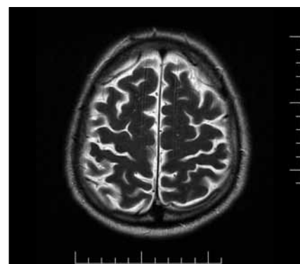
Obr. 1. MR mozku: T2 turbo spin – echo sekvence. V transverzální rovině je patrná lehká kortikální atrofie fronto-parietální oblasti oboustranně.

Samotný průnik spirochet do CNS však nemusí znamenat další progresi onemocnění. Abnormální likvorový nález může být pouze přechodný a většinou se do dvou let spontánně normalizuje [14]. Do klinicky manifestní formy přechází jen asi 5 % případů neléčené asymptomatické neurosyfilis. Riziko progresu je výrazně