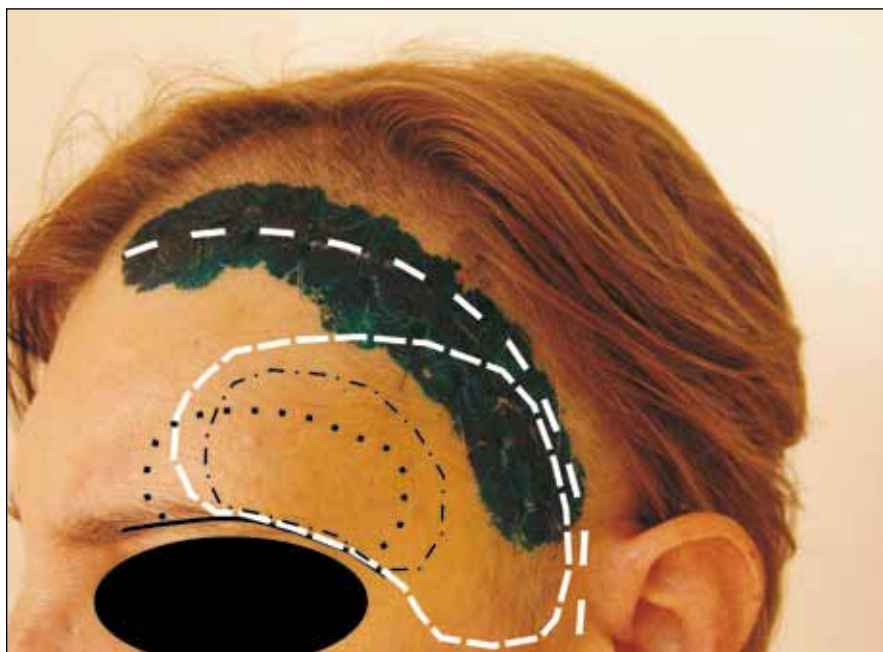
Obr. 2. Pterionální, LSO a mini-LSO.

Pacientka po operaci aneuryzmatu z LSO kraniotomie dle Hernesniemiho. Kožní řez krytý Novikovem, kraniotomie naznačena černou čerchovanou čarou. K porovnání je patrné LSO dle Perneczkeho (černá tečkovaná čára) z řezu v obočí (černá čára) a klasický pterionální přístup (bílé čáry).