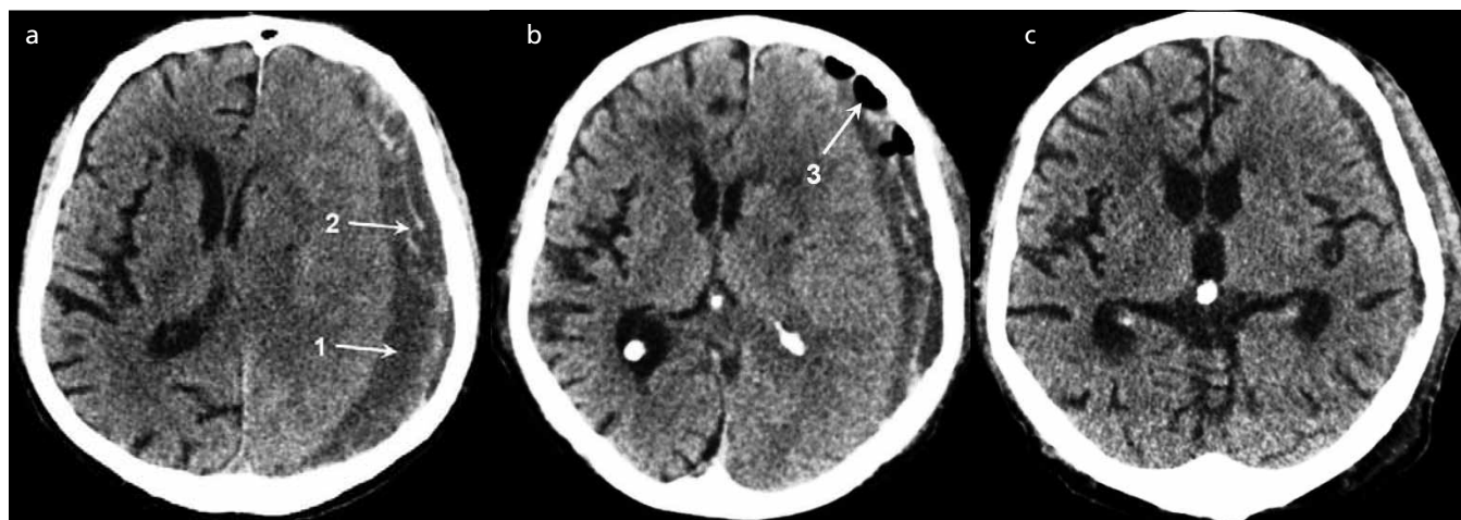
Obr. 1. Nativní CT nálezy u pacienta z kazuistiky 1.

Mezi 180 pacienty s celkem 201 operovanými symptomatickými CSDH se vyskytly tři případy organizovaného hematomu (1,5 %; tab. 1). Všichni byli muži, dva vysokého věku, třetí 54letý. Pouze u něj, aktivního sportovce, byla anamnéza pádu na hlavu při běžkaření. Průměrná šíře CSDH i přetlak střední čáry byly ve srovnání s ostatními pacienty vyšší (26,6 mm ku 18 mm a 12 mm ku 10 mm). U všech byla na CT popsána septa, stejně jako u 20,4 % zbylých CSDH, která však byla vždy vyřešena jednou až třemi evakuacemi z trepanace s laváží subdurálního prostoru. U těchto tří pacientů byla první či další evakuace z návrtu bez většího efektu a zlepšení klinického stavu