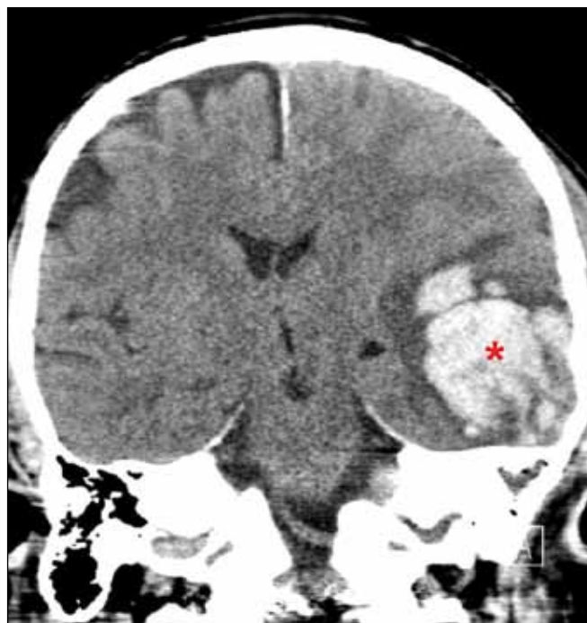
Obr. 2. Kontrolní CT s progresí kontuze (*).

*Rozvíjející se kontuzní ložisko temporálně vlevo.