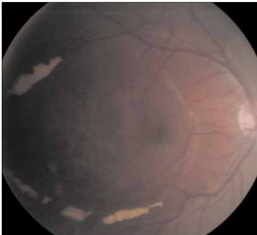
Obr. 3. Ohraničená, bělavá depozita (rezidua po krvácení) demarkovala po pars plana vitrektomii pravého oka periferní hranici původního krvácení pod vnitřní limitující membránou sítnice oválného tvaru.

mace a ostatních příčin velmi vzácné [1,2]. Šestnáctiletý chlapec utrpěl krvácení intraparenchymální, intraventriculární, intravitreální a krvácení pod vnitřní limitující membránou sítnice po předávkování metamfetaminem.