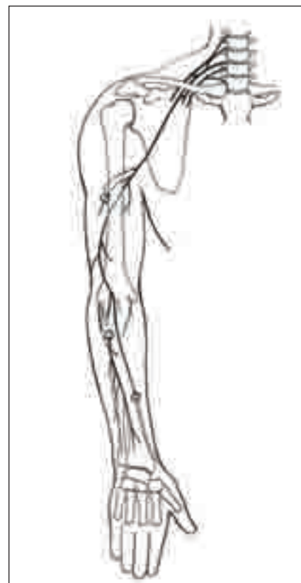
Obr. 1. Typická místa poranění nervu: v axile, ve střední části paže, v oblasti hlavičky vřetenní kosti a v oblasti n. superficialis na distálním předloktí a zápěstí.

Funkční zhodnocení souboru a dosažené klinické hodnoty v obnoveném rozsahu pohybu a získané svalové síle jsou sumarizovány v tab. 2. U všech pacientů bylo dosaženo obnovení pohybu prstů, palce i zápěstí do extenze umožňující funkční úchop rukou a manipulaci s předměty. Medián hodnoty DASH skóre ve sledo-