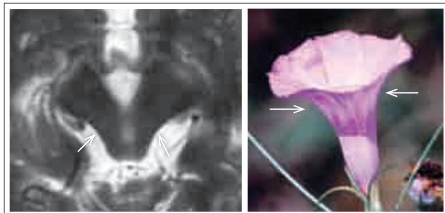
Obr. 2. Morning glory sign (příznak svlačce). Šipky ukazují na konkavitu (atrofii) tegmenta.