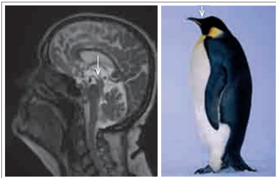
Obr. 4. Standing penguin silhouette (příznak stojící tučňáka). Šipky ukazují opět na fokální atrofii tegmenta.

pontu a dále gliózu v retikulární formaci, pontocerebelárních vlákních mezi lemniscus medialis a pyramidovou dráhou a v křížících se pontocerebelárních vlákních [4]. Nicoletti et al měřili šíři středního mozečkového pedunklu na T1 vážených sekvencích u 16 pacientů s MSA a 26 pacientů s IPD, s průměrným trváním nemoci 5–6 let, byli schopni kompletně rozlišit IPD od MSA. Putaminální hyperintenzity popsali u šesti pacientů s MSA, ale u žádného pacienta s IPD a „hot cross bun sign“ popsali u osmi pacientů s MSA [5].