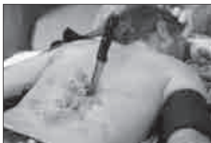
Obr. 1. Nůž byl pevně zaklíněn v oblasti dolní hrudní páteře.

Symptomatika po příjezdu na Neurochirurgické oddělení Nemocnice České Budějovice (ASIA): neurologická hranice C4. Zóna parciální inervace C5–L2. Motoricky C5–S1 vpravo stupeň 0 svalového testu. Vlevo C5–Th1 stupeň 4 a L2 stupeň 3 svalového testu. Od L3 kaudálně je přítomna totální paralýza. Volní kontrakce anu byla přítomna. Senzitivně pro obě modalit: C4 stupeň 2 oboustranně. Od C5 kaudálně stupeň 1 vpravo a stupeň 2