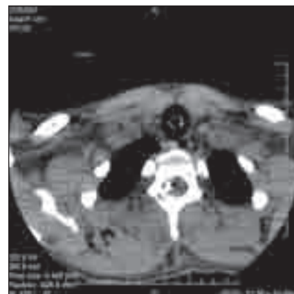
Obr. 6. CT obraz přítomnosti cizího kovového tělesa (část hrotu nože) v páteřním kanálu na úrovni Th1/2 vpravo.

tomie L4 vlevo, mikrochirurgická sutura kořenů a plastika pleny pomocí záplaty a tkáňového lepidla. Po operaci je klinický obraz bez změny a pacient je 14. pooperační den propuštěn do domácí péče. Následně vzniká rozsáhlá podkožní likvorová pseudocysta. Byla indikována revize rány. Vzhledem k infekčnímu onemocnění, které nijak nesouviselo s úrazem, byla revize provedena dva měsíce po první operaci. Pacient byl přijat na neurochirurgické oddělení s mírnou intermitentní cefaleou a rozsáhlou rezistencí v podkoží na zádech v oblasti dolní bederní oblasti. Zobrazovací vyšetření prokazuje likvorovou pseudocystu (obr. 4). Operační revize: 4. 12. 2009 byla provedena revize pseudocysty s evakuací likvoru a vícevrstevná plastika pleny. Po několika dnech od operace se znovu naplňuje podkoží likvorem. Proto byla indikována další revizní operace 15. prosince 2009: bylo nalezeno místo prosakování likvoru podél stehu. Opětovná vícevrstevná plastika byla nyní doplněna lumbální drenáží. Po operaci je na kontrolní MR jen minimální reziduální depo likvoru v podkoží, klinicky nezaznamatelné (obr. 5). Pacient byl propuštěn do domácí péče. Reziduální motorický deficit kořene L5 trvá.