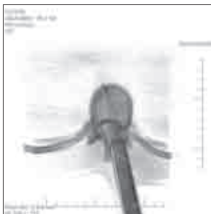
Obr. 2. Rekonstrukce CT vyšetření zobrazuje trajektorii.

Kuchyňský nůž pronikl zprava zezadu páteřním kanálem a dále dopředu přes tělo 11. hrudního obratle.