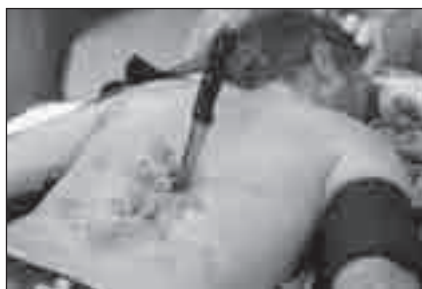
Obr. 1. Nůž byl pevně zaklíněn v oblasti dolní hrudní páteře.

Symptomatika po příjezdu na Neurochirurgické oddělení Nemocnice České Budějovice (ASIA): neurologická hranice C4. Zóna parciální inervace C5–L2. Motoricky C5–S1 vpravo stupeň 0 svalového testu. Vlevo C5–Th1 stupeň 4 a L2 stupeň 3 svalového testu. Od L3 kaudálně je přítomna totální paralýza. Volní kontrakce anu byla přítomna. Senzitivně pro obě modalit: C4 stupeň 2 oboustranně. Od C5 kaudálně stupeň 1 vpravo a stupeň 2