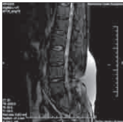
Obr. 4. Na sagitálním T2 váženém obraze je patrná objemná likvorová pseudocysta v podkoží v oblasti bederní páteře.