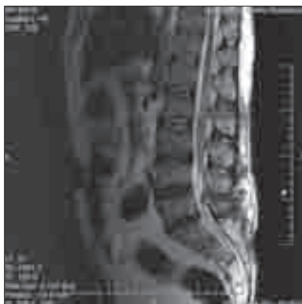
Obr. 5. Pooperační MR s příznivým nálezem vymizení objemné kolekce likvoru v podkoží.