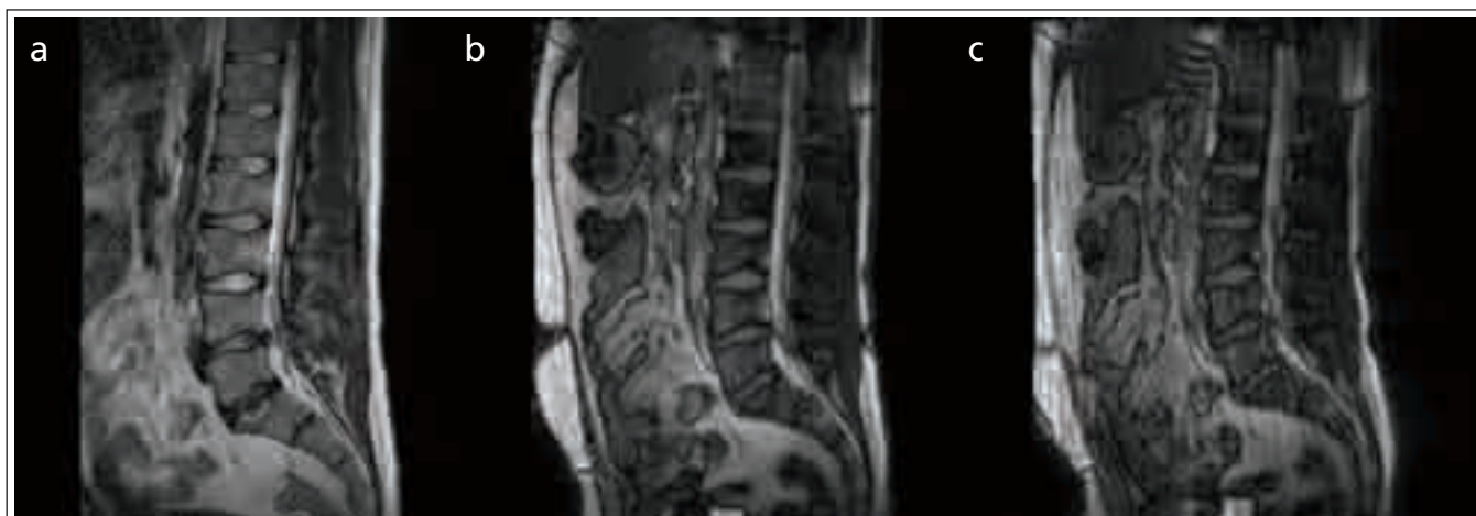
Obr. 4a–c. MR a dMR vyšetření z dne 2. 6. 2009.