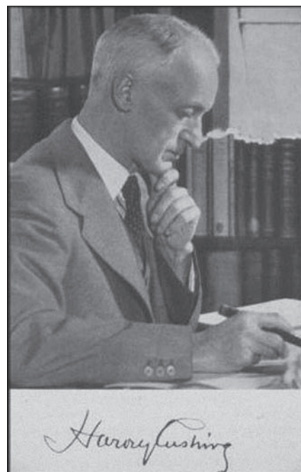
Obr. 1. H. W. Cushing.

Jeho život je podrobně popsán v několika knihách, které se liší jen temperamen-tem autora a jeho vztahem k hrdinovi. Práci jim usnadnil sám Harvey. Měl totiž vlastnost, kterou mu závidím, protože se mi jí nedostává. Harvey byl systematick, pedant, puntičkář, zkrátka zapsal všecko, co udělal a prožil. Po Cushingovi zůstaly zásluhou několika jeho obdivovatelů snad tisíce dopisů, všechny jeho články, knihy, dokonce všechny chorobopisy jeho pacientů, včetně chorobopisů vojáků, které