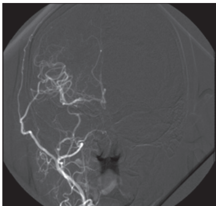
Obr. 2. Příklad nejlepšího stupně 3b plnění bypassu, anastomózou je zásobena i a. cerebri anterior.

kého stupně plnění EC-IC bypassu a CVRC byl hodnocen pomocí neparametrického Kruskal-Wallisova testu (nulová hypotéza: mediány jsou u všech tří skupin sobě rovný).