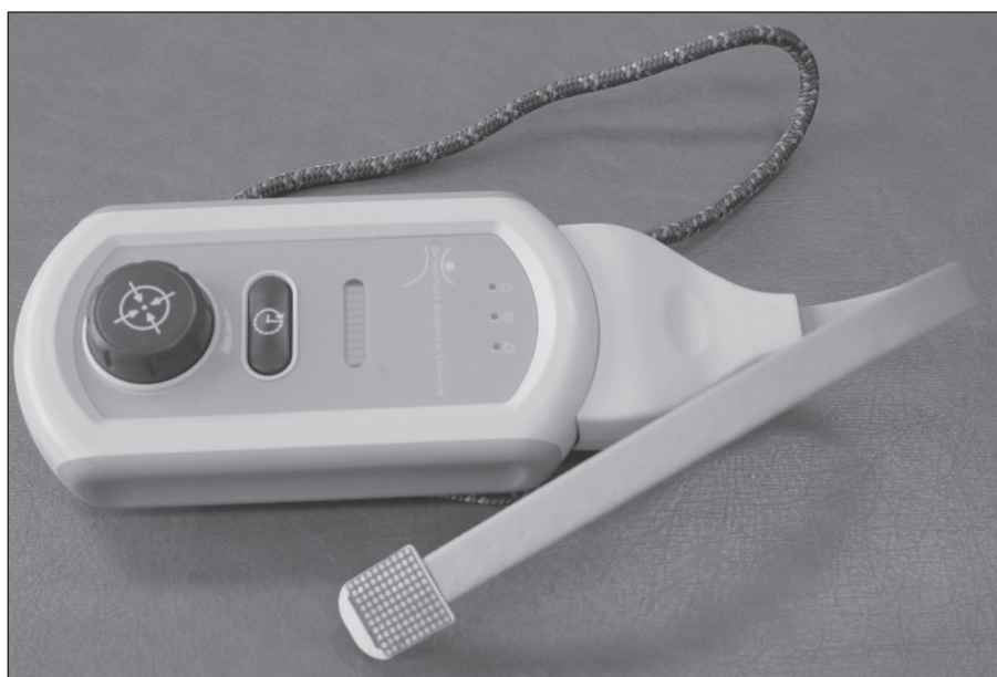
Obr. 1. BrainPort – akcelerometr se stimulačními elektrodami a řídicí jednotka.

BP jsme použili u 64letého pacienta s těžkou instabilitou stoje a chůze na podkladě ischemické CMP ve vertebrobazilárním povodí, kterou prodělal v roce 2005. Na MR prokázány infratentoriálně v levé mozečkové hemisféře a levé polovině prodloužené míchy ložiska změněného sig-