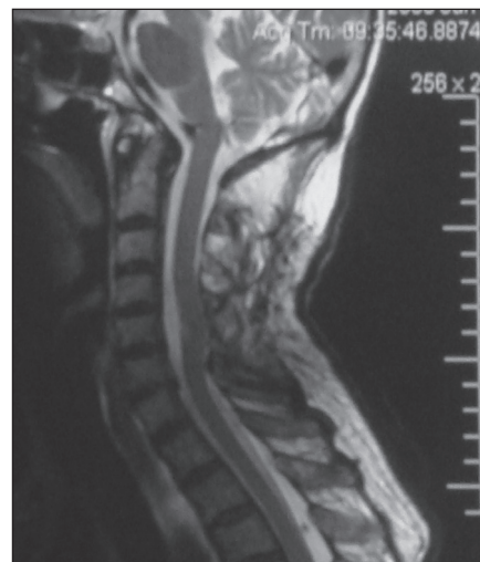
Obr. 2. MR obraz po ATB liečbe.

kázané jednoznačné patologické zmeny. Elektrónovomikroskopické a PCR vyšetrenie zbytku biptickej vzorky neboli vykonané. Až po operácii boli známe hodnoty antiboreliových protilátok ELISA metódou: IgM v sére a v likvore pozitívne, IgG v sére 270,0 IU/ml pozitívne, v likvore 300,0 IU/ml pozitívne, čím bola definitívne potvrdená diagnóza boreliovej radikulomyelitídy. Pacient bol liečený ceftriaxonom parenterálne 21 dní, pulzmi metylprednizolonu 250 mg denne počas piatich dní a symptomatickou terapiou. Súčasne s medikamen-