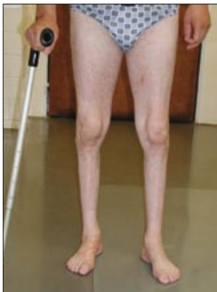
Obr. 5. Distální HMN II AD s prokázanou mutací v HSP 22 genu.