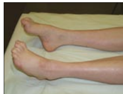
Obr. 3. CMT 1A s typickou deformitou pes cavus, kladívkovými prsty a peroneální atrofií.

Tato forma je způsobena mutací SIMPLE genu [13] a je relativně vzácná. Dosud bylo popsáno pouze šest mutací v tomto genu. Fenotyp je charakterizován nástupem na přelomu 1. a 2. dekády, lehkým pes cavus a distálními svalovými atrofiemi, areflexií L5/S2 a poruchami čítí. Měli jsme možnost vidět matku a dceru s abnormální chůzí (zakopávání, nelze stoj na paty), lehkou deformitou nohou a mírným zkrácením Achillových šlach. Na rukou byly jen naznačeny svalové atrofie se zachovanou jemnou motorikou prstů. Elektrofyziologické studie jsou zajímavé přítomností