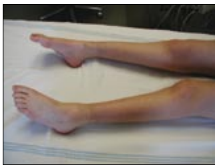
Obr. 4. CMT 2A s těžší chabou paraparézou od 1. dekády.