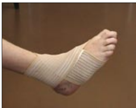
Obr. 7. Elastická bandáž hlezna slouží ke stabilizaci kloubu.

procedury s cílem zlepšit prokrvení a trofiku paretických svalů a ulevit od bolesti jak neuropatické, tak sekundární, obvykle myoskeletálního původu. Ergoterapie se soustředí na nácvik jemné motoriky horních končetin.