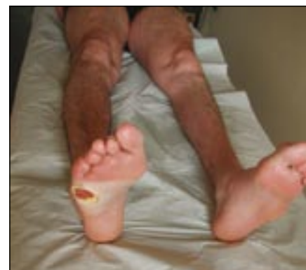
Obr. 6. HSN1 – ulcerace pod hlavičkou V. metatarzu.

Pravděpodobnost detekce kauzální mutace klesá pod 5 %, pokud se vyloučí mutace v PMP 22, GJB 1, PO a MFN-2 genech. Jestliže DNA analýza neprokáže kauzální mutaci zodpovědného genu, není diagnóza CMT choroby vyloučena.