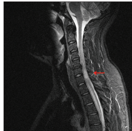
Obr. 1. MRI krčnej miechy (STIR, sagitálny rez) s rozsiahlym intramedulárnym hyperintenzívnym ložiskom.

MRI vyšetrenie mozgu a hlavy ukázalo normálny nález. MRI vyšetrenie krčného