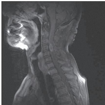
Obr. 1. MRI krční páteře v sagitální rovině, v T1 módu s kontrastem, před operací, na úrovni C4 intramedulární metastáza velikosti 24 × 12 mm, sytící se postkontrastně.

Muž ve věku 74 let, nekuřák, bez historie nádorového maligního onemocnění, udával krev ve stolici a váhový úbytek za posledních několik měsíců. Byl proto chystán ke kolonoskopickému vyšetření. Mezitím ale došlo náhle k rozvoji spastické kvadruparézy s prevalencí na pravostranných končetinách, především na pravé horní končetině s postižením svalů ramenního pletence a projevující se neschopností elevace končetiny v rameni. Obě dolní končetiny udržel v Mingazzinim, nebyl schopen chůze a byl popsán jednorázový únik stolice. Následně bylo provedeno akutní vyšetření magnetickou rezonancí (MRI) krční páteře s nálezem intramedulární expanze ve výši C4 s navazující syringomyelickou dutinou zasahující v kraniálním směru po medulla oblongata a v kaudálním směru po Th 4. Expanze byla v T2 a STIR sekvencích hyposignální a po aplikaci kontrastní látky se sytila nepravidelná periferní část formace. Velikost tumoru byla 24 × 12 mm se zřetelným ohraničením oproti zbytku míchy (obr. 1, 2). Pacient byl od začátku léčen kortikoidy (metylprednisolon) a neurologický stav se stabilizoval do té míry, že nedošlo k rozvoji plegie. Po dvou dnech od začátku příznaků bylo indikováno operační od-