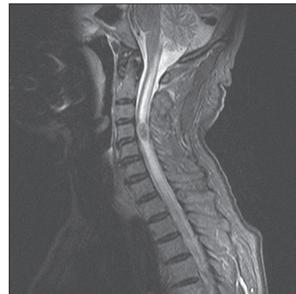
Obr. 2. MRI krční páteře v sagitální rovině, ve STIR modu, před operací, na úrovni C4 intramedulární metastáza se syringomyelickou dutinou kraniálně a kaudálně probíhající.