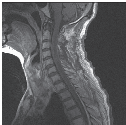
Obr. 3. MRI krční páteře v sagitální rovině, v T1 módu s kontrastem, dva dny po operaci, bez známek tumoru.