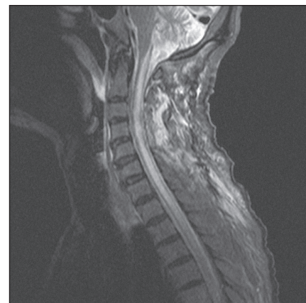
Obr. 4. MRI krční páteře v sagitální rovině, ve STIR módu, dva dny po operaci, bez známek tumoru, se syringomyelickou dutinou.

stranění míšní expanze. Z levostranné hemilaminectomie C4, parciální hemilaminectomie C3 a C5 a ze středočárové myelotomie autoři kompletně odstranili zčásti prokrváčený, jinak hnědoběžový, křehký a relativně ohraničený míšní tumor. Druhý den po operaci kontrolní MRI s kontrastem potvrdila radikální odstranění a dekompresi míchy (obr. 3, 4). Operační rána se zhojila bez komplikací a neurologický stav pacienta se mírně upravil, zejména se zvětšil rozsah elevace pravé horní končetiny. Hybnost dolních končetin zůstala zachována beze změny a pacient byl nadále upoután na lůžko.