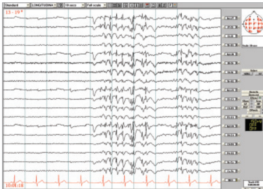
Obr. 2. Kazuistika IGE s fantomovými absencemi. Generalizované SW někdy pravidelné, někdy nepravidelné 3–5 Hz nebo izolovaně v trvání maximálně 5 sekund, prokázán záraz v činnosti. Longitudinální zapojení, LF 0,53 Hz, HF 70 Hz.

26letý muž byl odeslán k video-EEG monitorování s diagnózou stp. 1. neprovokovaném GTCS, MRI nelezionální, v EEG generalizované SW výboje. K posouzení kognitivní poruchy během SW výbojů. Byly zachyceny četné úseky generalizovaných výbojů SW 3–6 Hz, které trvaly až 5 sekund. Objevovaly se většinou při ospalosti, často po zavření očí, ale i při očích otevřených. Převážně neměly žádný behaviorální korelát, jen ojediněle bylo možno pozorovat mrkání nebo lehký pokles zvednutých horních končetin. Nejnápadnější změny byly zachyceny v průběhu vytukávání textové zprávy na mobilním telefonu, kdy současně se začátkem výbojů (obr. 2) došlo k zárazu v této činnosti, ale v pauze mezi výboji a po jejich skončení vytukávání pokračovalo.