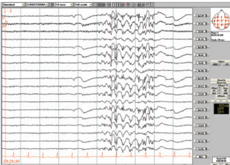
Obr. 4. Kazuistika Jeavonsův syndrom. Po zavření očí generalizované výboje SW/PSW místy pravidelné, místy nepravidelné 3–5 Hz, v trvání většinou do 5 sekund. Longitudinální zapojení, LF 0,53 Hz, HF 70 Hz.

zvážení epileptochirurgického výkonu. Záchvaty se začaly vyskytovat ve 4 letech věku – jednalo se o záškuby levého koutku (dříve uváděno i pravého), izolované či repetitivní, trvající několik sekund – i déle,