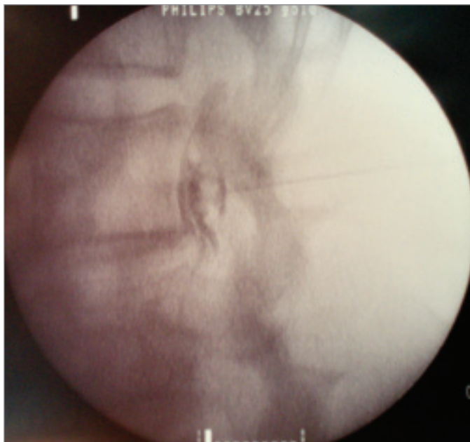
Obr. 1. Pulzní RF-DRG L3 – rtg snímek v boční projekci po aplikaci kontrastní látky.

Vysvětlivky – Pulzní radiofrekvence dorsal root ganglion třetího bederního míšního nervu (pulzní RF-DRG L3).