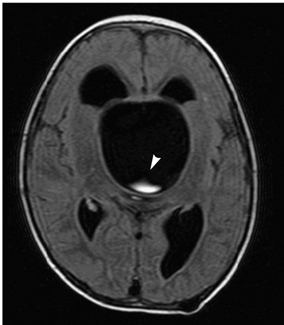
Obr. 2. Předoperační MRI u pacienta č. 4. Na FLAIR sekvencích je možné pozorovat proudění moku směřující od bazilární arterie směrem vzhůru do supraselární cysty (šipka).

kteřá již dle CT imponovala jako supraselární cysta. Na spádové dětské neurochirurgii byl pro obstrukční hydrocefalus pacientovi zaveden ventrikulo-peritoneální (VP) zkrat (Medtronic Medium), ale po 6 měsících od operace se kývání zvýraznilo a připojilo se i kývání trupem. Byla provedena MRI. U chlapce se začaly projevovat příznaky těžké poruchy vizu. Byl proveden pokus o zavedení cystoperitoneálního zkratu pod skiaskopickou kontrolou, do cysty se však drenáž zavést nepodařilo, výsledkem výkonu bylo zavedení druhého proximálního katétru do postranní komory a vytvoření duplicitního VP zkratu. V této době byl chlapec předán do naší péče s již pokročilým poškozením zraku. Při příjmu jsme zaznamenali výraznou makrocefalii, obvod